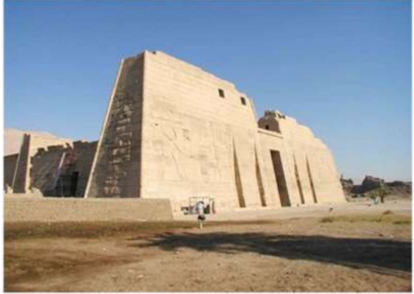
٣. منظر لواجهة معبد إدفو بمصر المبني في العصر البطلمي لمقارنته بمنظر معبد قصر بنت الفرعون بيترا