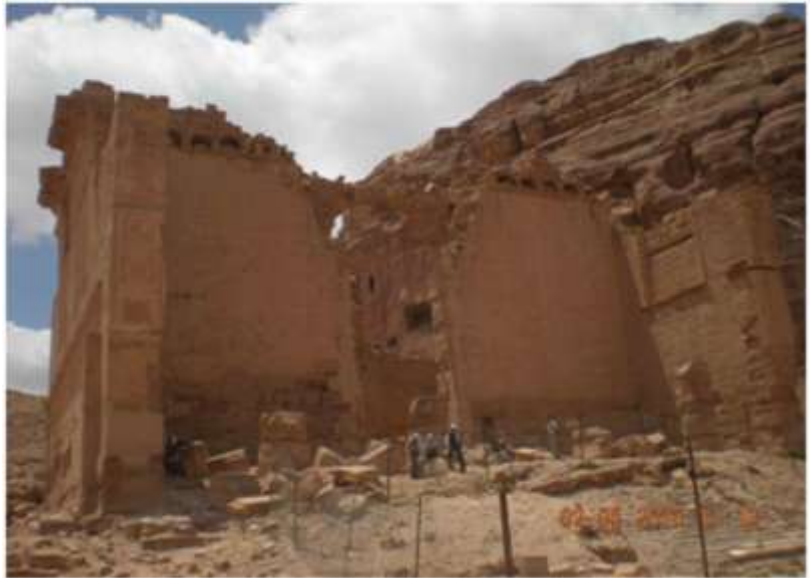
٢. منظر لمعبد ذو الشرى و يطلق عليه معبد بنت الفرعون