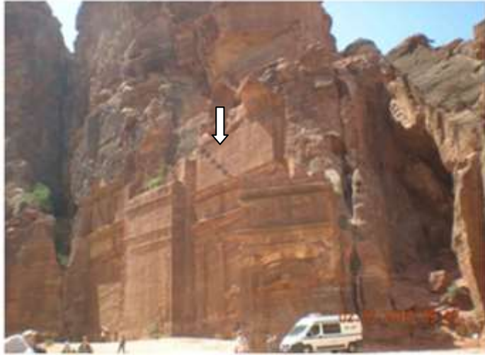
٤. منظر لسلم أوزوريس ملك الموتى لدى المصريين على واجهة بيترا