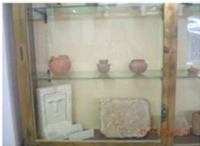
٨. العزى في متحف قصر عمان