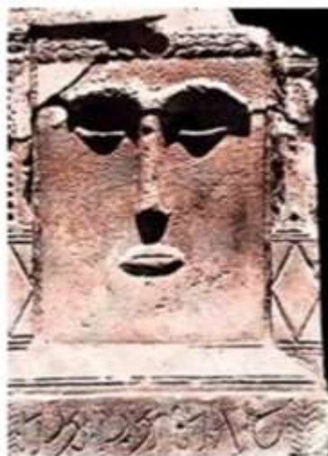
٧. العزى في بئرا